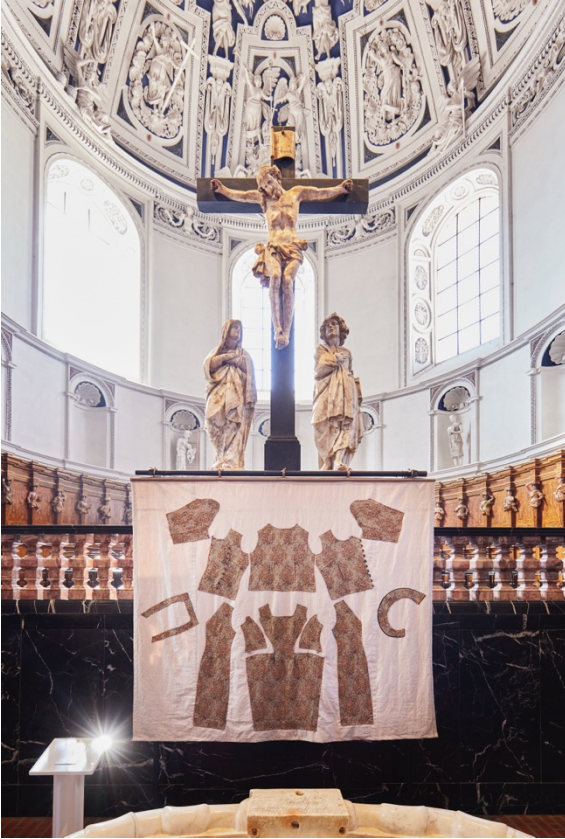
Konservierte Erinnerung - Applikation von Nicolaus Werner im Dom St. Peter - Foto Sebastian Heck