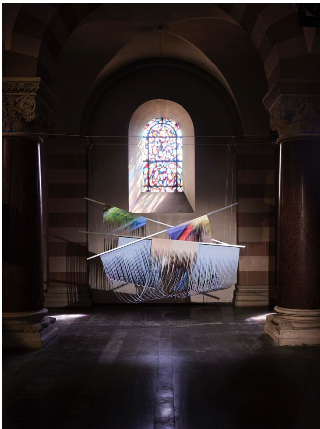
Cutted, Installation von Nicola Schudy in der Pauluskirche