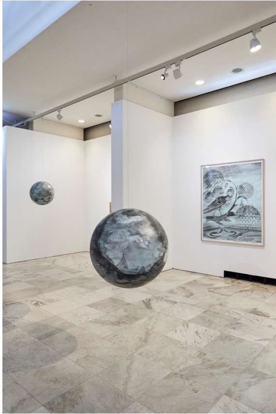
Ausstellungsansicht von Katja Davar im Museum am Dom